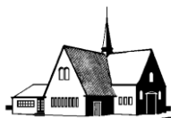
GEREFORMEERDE KERK Loosdrecht